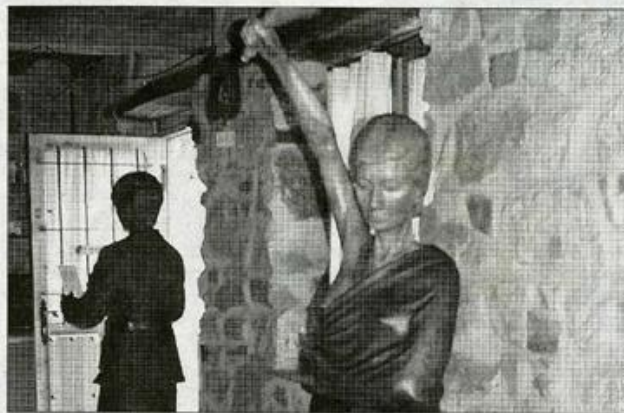
La escultura de madera de la foto es una de las obras más recientes de Revilla.

PLANTA BAJA. En la planta baja se han ubicado esculturas de madera, muchas a tamaño real. Entre ellas, destacan la obra con la que ha querido realizar un homenaje a la galleta María y todos sus años como trabajador de la desaparecida empresa galletera. Además, su esposa, estatuas de personas anónimas realizando las labores tradicionales y los decorados de las vigas son algunas de las representaciones que se pueden observar en todo ese piso.