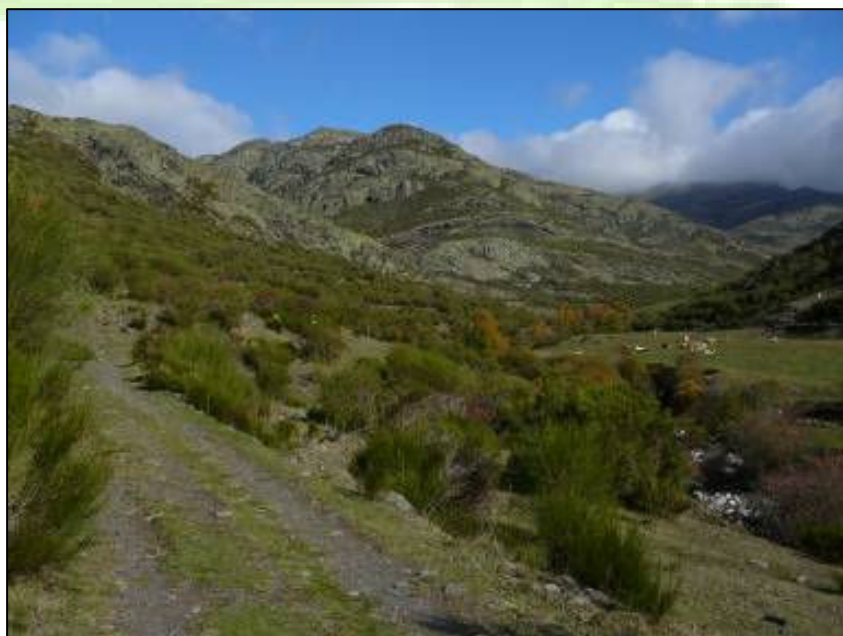
Sendero del Pozo Lomas