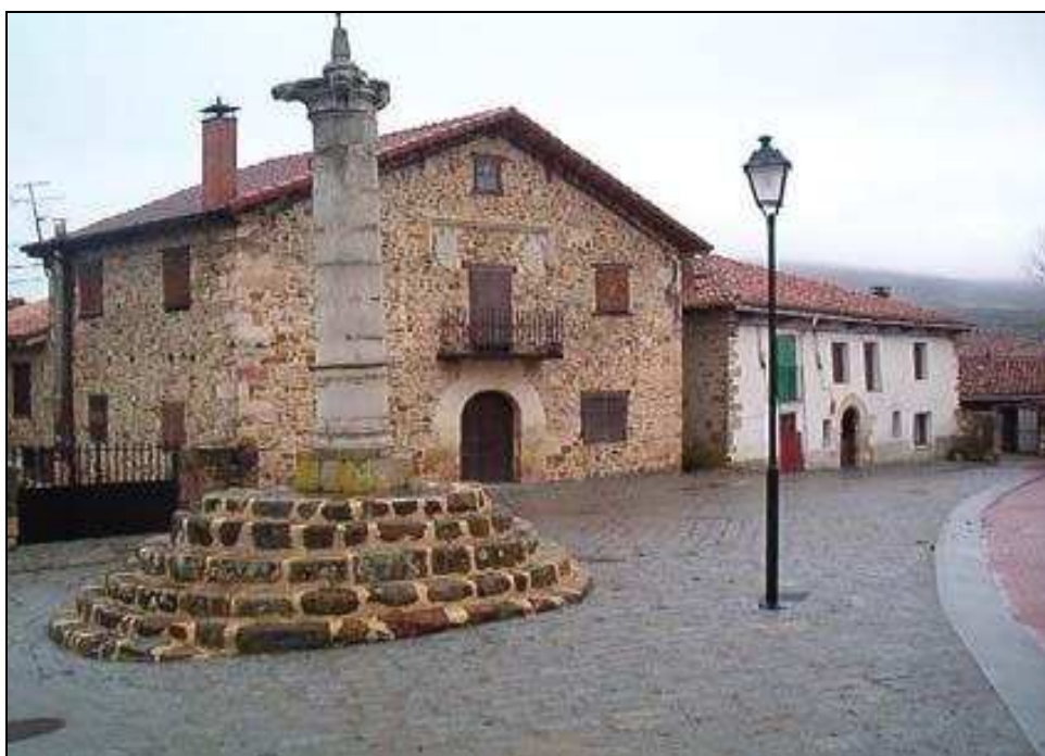
PLAZA DEL ROLLO EN SAN SALVADOR DE CANTAMUDA

En el Parque desde su declaración y hasta el año 2009 se ha mantenido otra línea de ayudas de la Consejería de Medio Ambiente que tenía como destinatarios a los propietarios particulares de casas o naves y otras instalaciones ganaderas.