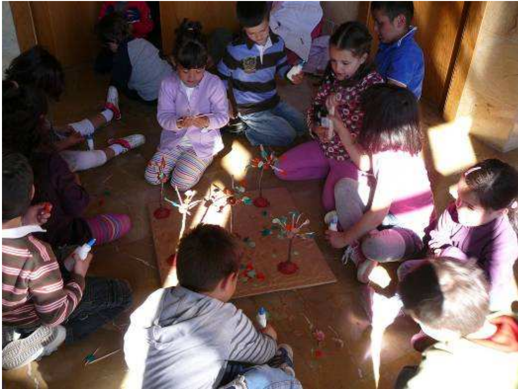
Alumnos de Educación Infantil realizando el taller “Salvemos los Bosques”