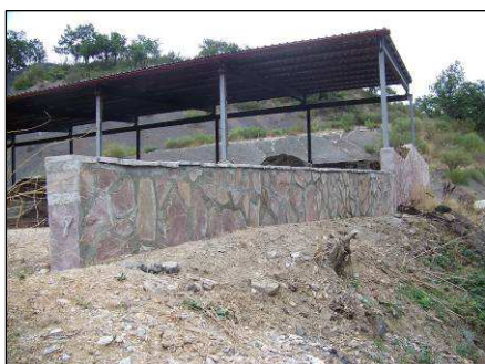
ABONEROS DE STA. MARIA DE REDONDO

En esta misma localidad se han edificado unos aboneros para que sean utilizados por los ganaderos de la localidad para almacenar el estiércol, y poder retirar el que se almacenaba al inicio de la senda. Estas actuaciones de construcción de infraestructuras de uso público ha supuesto una inversión del Parque en la Pernía de más de 260.000€.