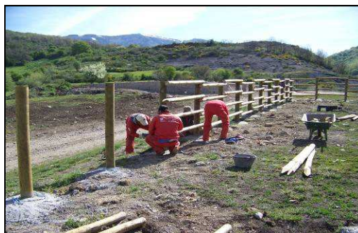
MANGA GANADERA DE STA. MARIA DE REDONDO

En estos diez años, para el Parque ha sido igualmente importante la mejora paisajística en este caso del municipio de la Pernía, y a ello también se han dedicado esfuerzos por medio de la cuadrilla. En este sentido se ha actuado la mejora de la manga ganadera de Santa María de Redondo en la que se sustituyeron los elementos metálicos por madera, y se ha retirado numerosos carteles en desuso o abandonados, que tanto afean el paisaje cuando se deterioran.