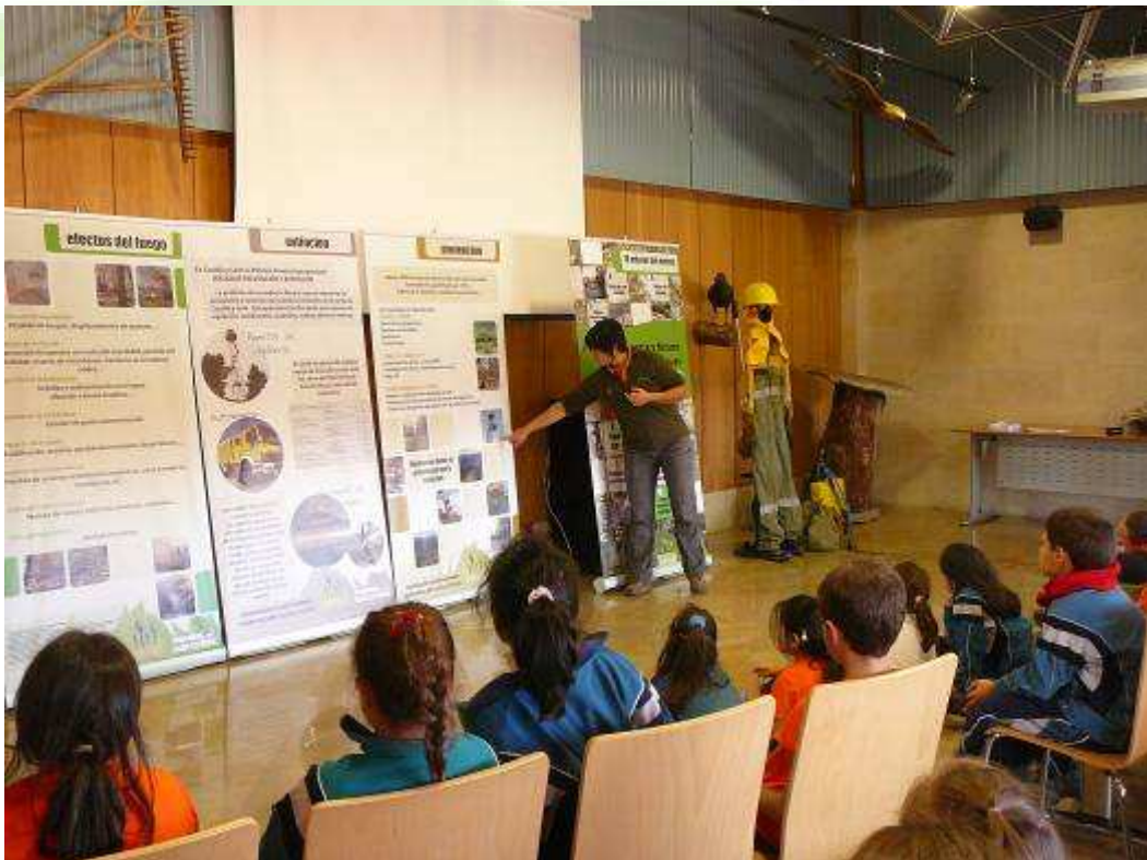
Alumnos de Educación Primaria atendiendo las explicaciones sobre incendios forestales previas al “Juego del Explorador del Bosque”