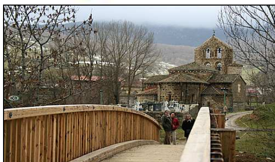
PASASERA DE SAN SALVADOR DE CANTAMUDA

Otra actuación importante fue la construcción de una pasarela peatonal y adecuación de plaza y paseo en San Salvador de Cantamuda por un importe de 144.272,97€. Se trata de la construcción de una pequeña plaza delimitada con un muro de piedra, y el arreglo y ajardinamiento de la margen izquierda del río desde el puente viejo hasta la nueva pasarela. La pasarela, de madera laminada facilita el acceso a la Colegiata .