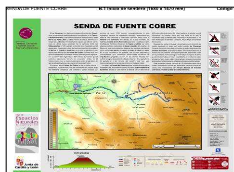
PANEL DE LA SENDA DE FUENTE COBRE

Otra actuación importante fue la construcción de una pasarela peatonal y adecuación de plaza y paseo en San Salvador de Cantamuda por un importe de 144.272,97€. Se trata de la construcción de una pequeña plaza delimitada con un muro de piedra, y el arreglo y ajardinamiento de la margen izquierda del río desde el puente viejo hasta la nueva pasarela. La pasarela, de madera laminada facilita el acceso a la Colegiata .