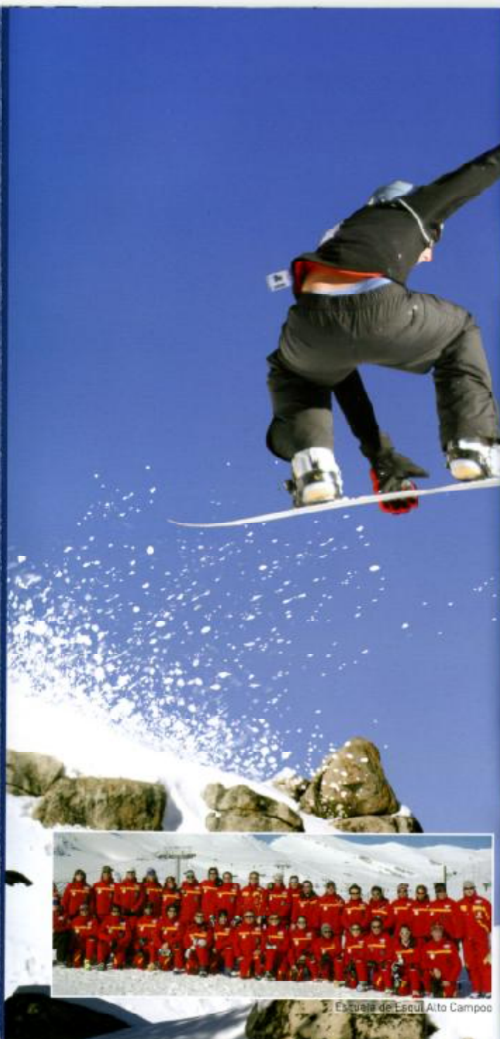
Escuela de Esquí Alto Campoo

Infantiles: hasta 12 años inclusive. Menores de 6 años gratis (presentando documentación que acredite la edad). Si desea pase de temporada: 30 Euros. Medio día: se considera a partir de las 13 horas. Mayores de 65 años gratis (presentando documentación que acredite la edad). Si desea pase de temporada: 30 Euros. Incluida la primera asistencia sanitaria en todos los forfaits y abonos. Precios especiales a grupos. Todos los precios incluyen I.V.A. y el Seguro Obligatorio Viajeros. Tarifas con posibilidad de ofertas puntuales. Descuentos a federados, previa acreditación. Para grupos y otros colectivos consúltenos. Para pases familiares deberá presentarse documentación que así lo acredite.