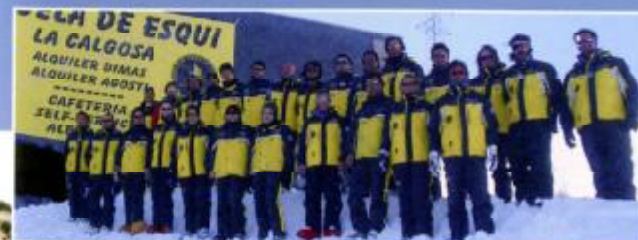
Escuela Calgosa de Esquí